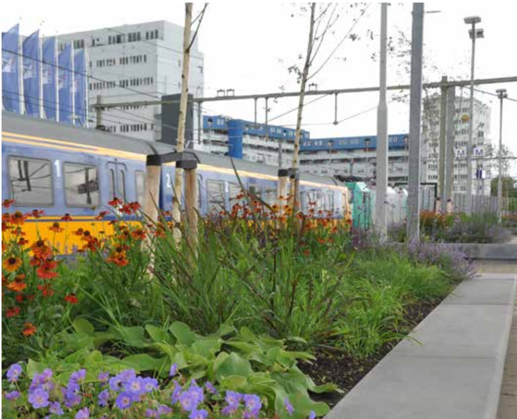
Beplanting in het reisdomein

station- en stadsontwikkeling te omarmen. Samengesteld op uitnodiging van, en in samenwerking met NS en ProRail agendeert Het Nieuwe Stationskwartier de kansen en de complexiteit die bij integrale gebiedsontwikkeling horen. Hoe krijg je rond het station de gewenste bereikbaarheid en leefbaarheid? Hoe verweven we stedelijke vraagstukken met spoorse opgaven?