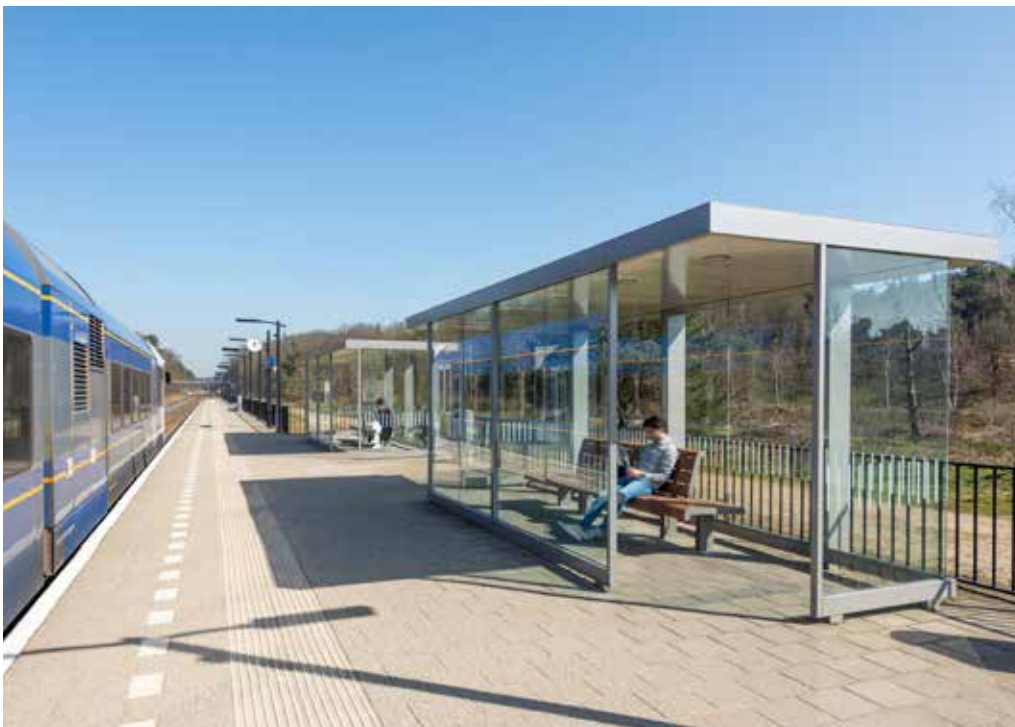
Stationsoutillage perron wachten