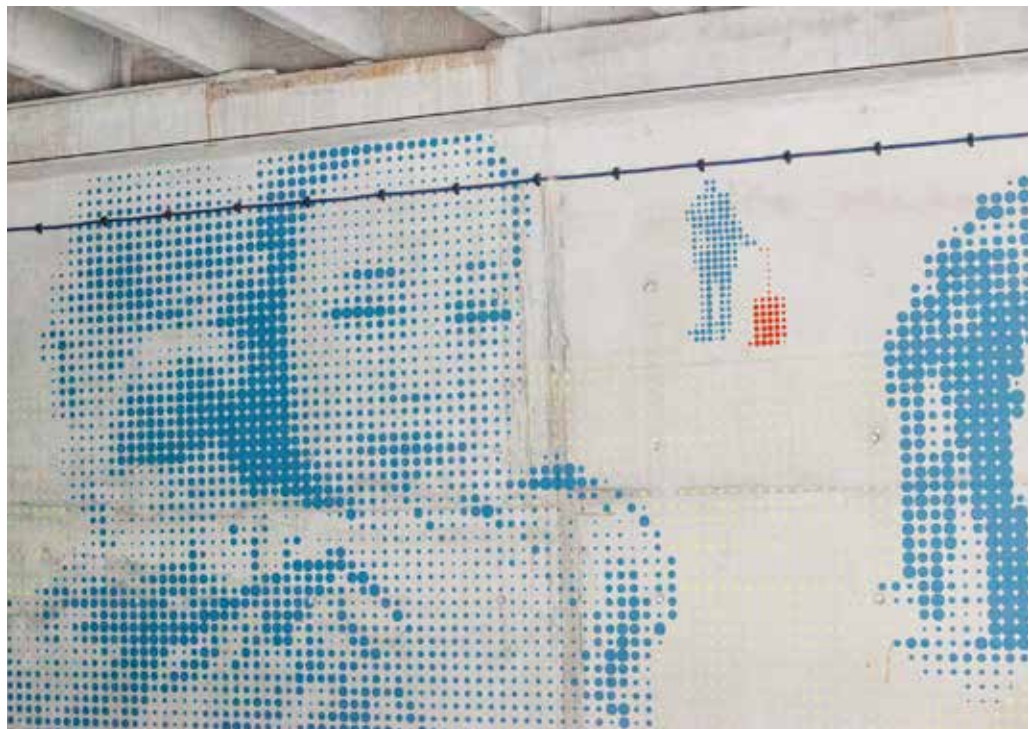
Kunstwerk Lichaam en Geest van Gabriel Lester

De lay-out van het station en de bewegwijzering zorgen dat reizigers en bezoekers makkelijk hun weg kunnen vinden. In de grotere stations kunnen stationsplattegronden een extra hulpmiddel zijn voor het vinden van voorzieningen als het toilet, de fietsverhuur of een speciale winkel.